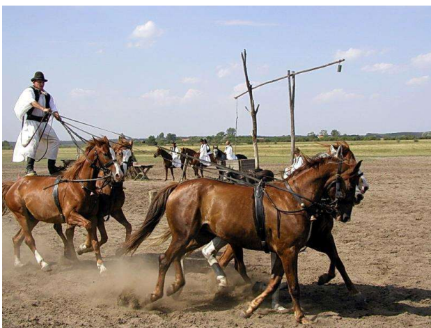
Parque Nacional de Hortobágy