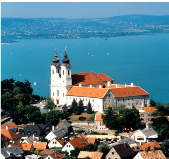
Tihany y el lago Balaton