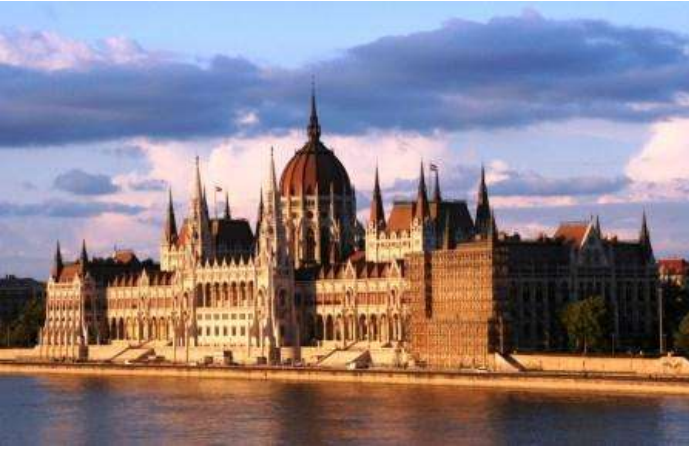
Parlamento húngaro el pas Danubio en Budapest