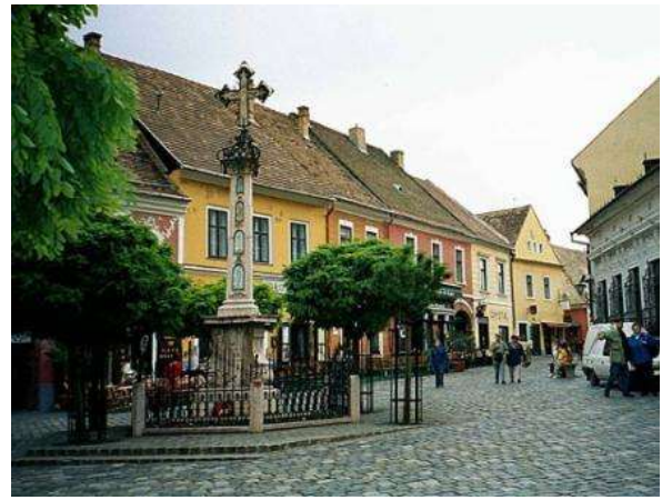
Szentendre (San Andrés)