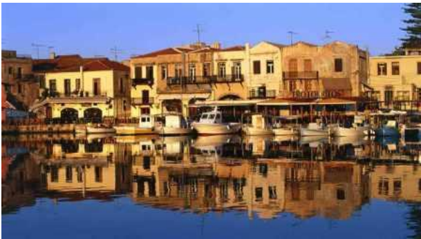
Puerto de Rethymnon