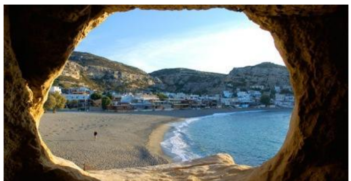
Playa de Matala desde una de sus cuevas