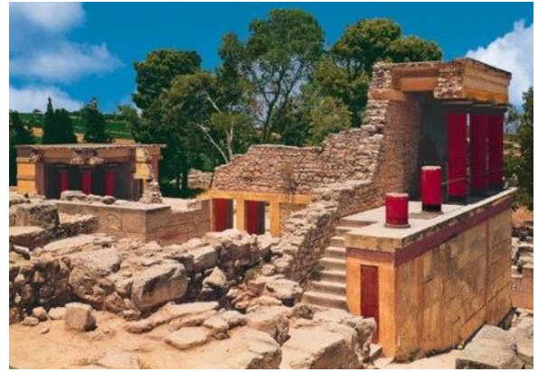
Palacio minoico reconstruido de Knosos