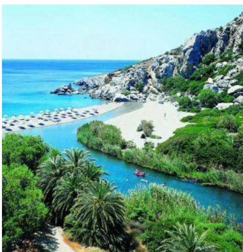
Fotogénica playa de Pleveli (Plakias)