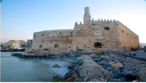
Heraklio, fortaleza de Kouli