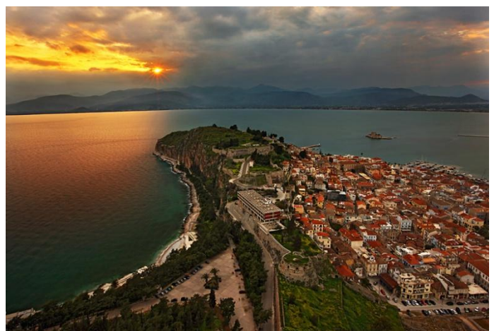
Pueblo de Náfplio