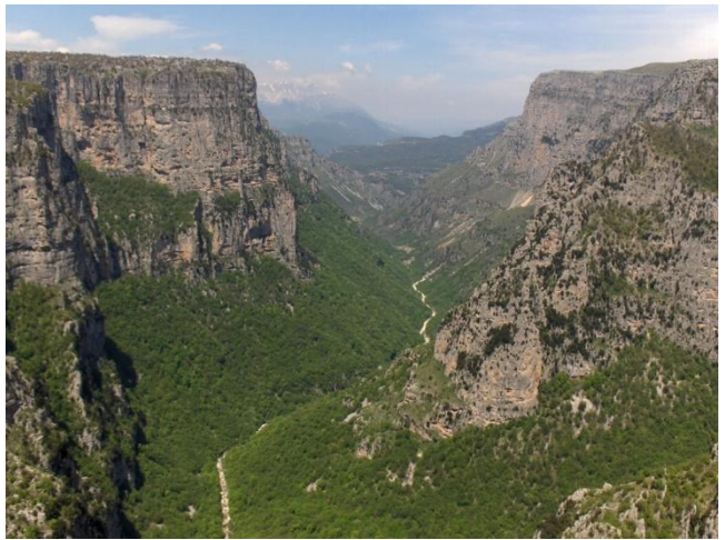
Desfiladero de Vikos