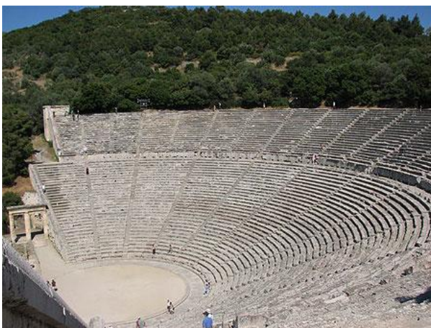
Teatro de Epidauro