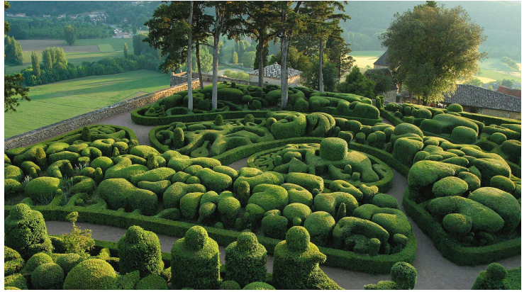
Jardines de Marqueyssac