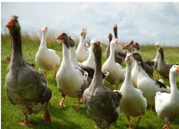
La tierra del foie