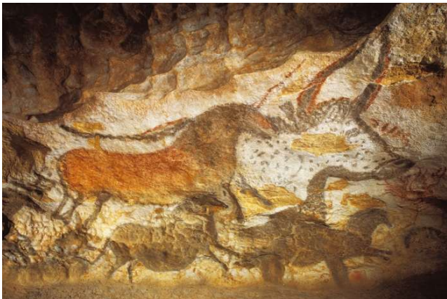
Cuevas de Lascaux II