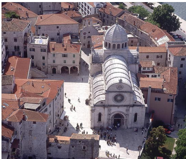
Catedral de Sibenik