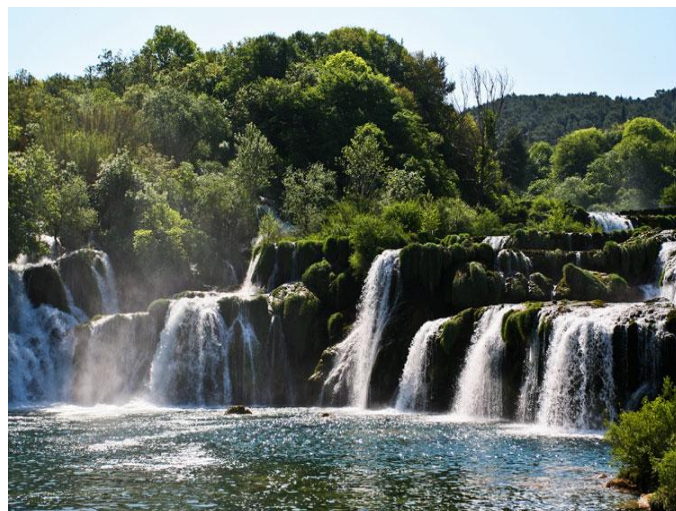
Parque Nacional del rio Krka