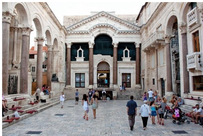
Peristilo del Palau de Diocleciano, Split