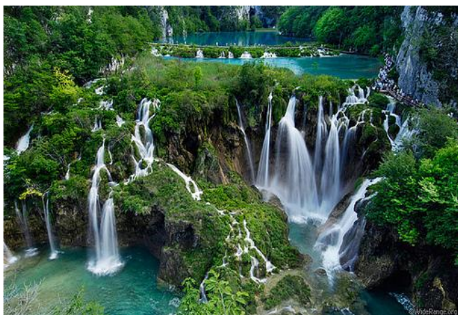
Llagos de Plitvice