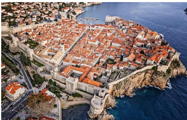
Dubrovnik, vista aérea