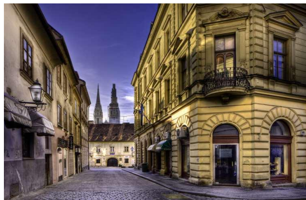
Zagreb, casco antiguo