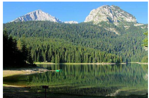
Parque Nacional de Durmitor