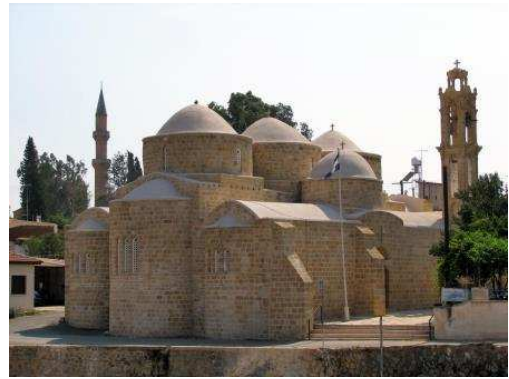
Sant Barnabás en Peristerona