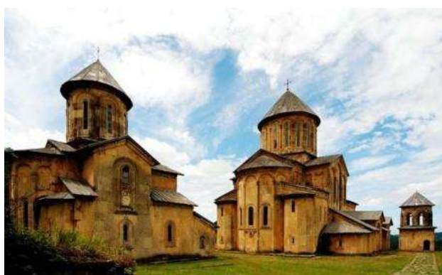
Monasterio de Gelati