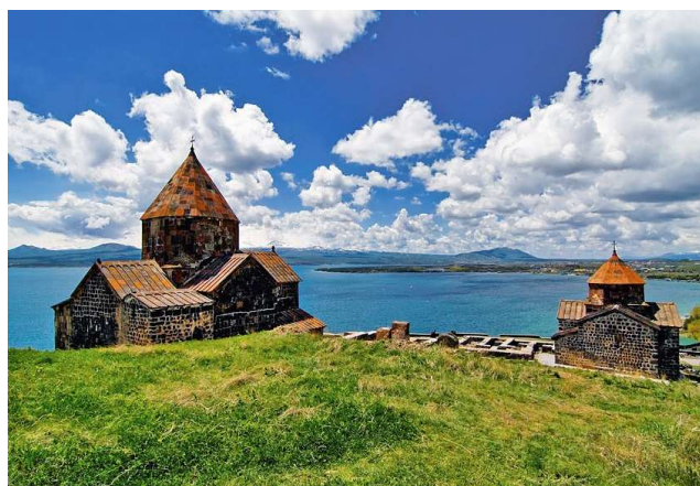
Sevanavank y lago Sevan