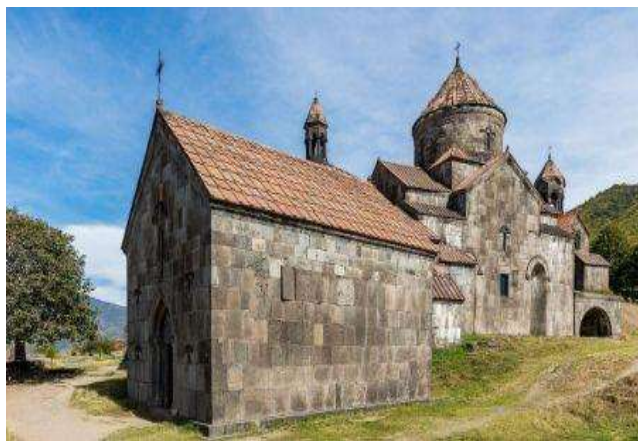
Monasterio de Haghpat