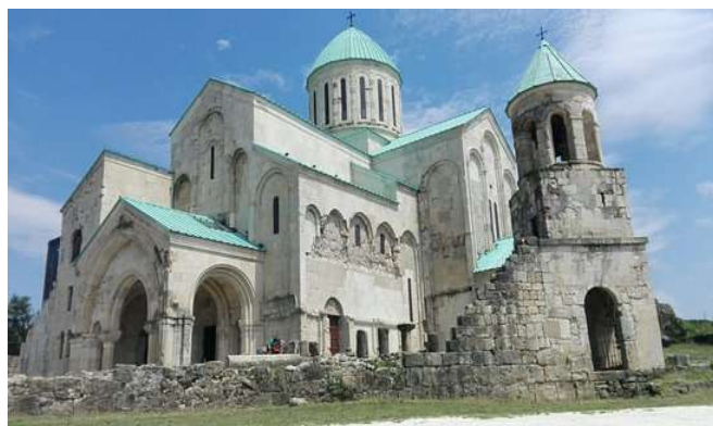
Catedral de Bagrati, Kutaisi