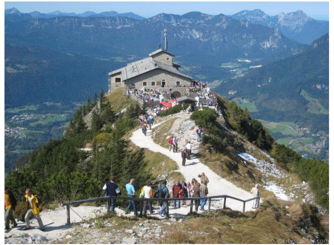
Niu de l'Àguila