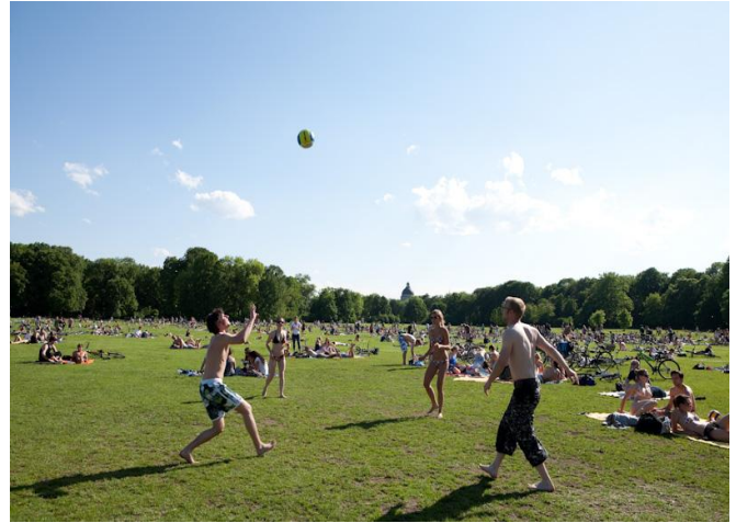
Munich: Jardins anglais