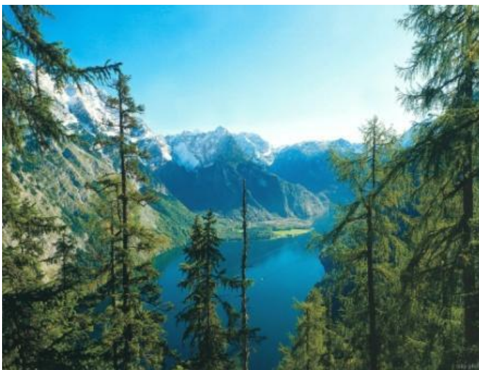
Parc natural de Berchtesgader