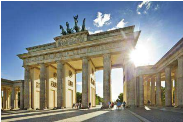
Puerta de Branderburgo (Berlín)