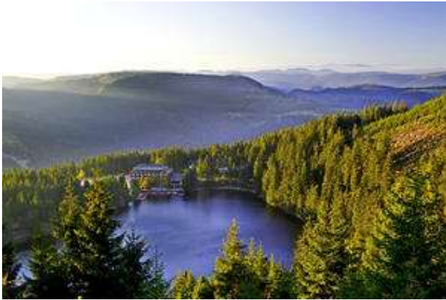
Lago de Mummelsee