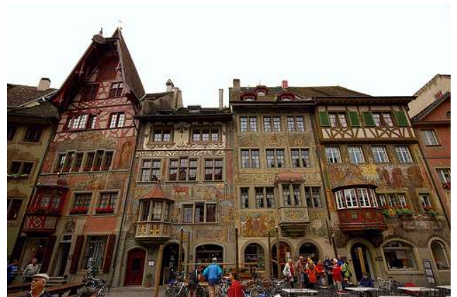
Stein Am Rhein (Suiza)