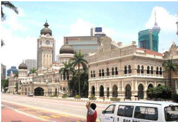
Kuala Lumpur: Mederka Square