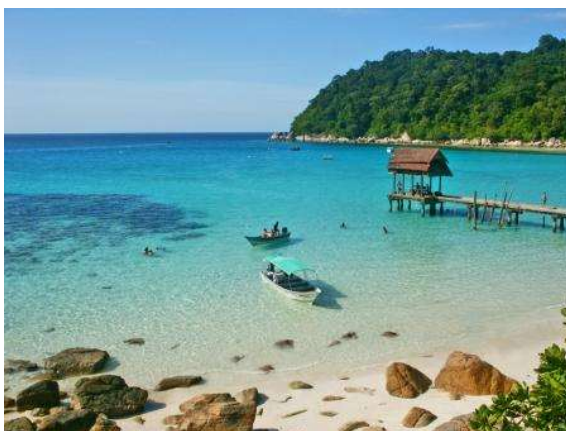
Pulau Perhentian Kecil