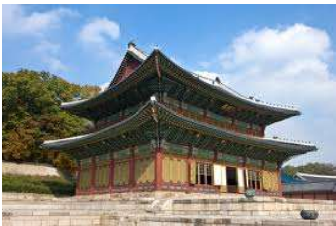
Palacio en Seül