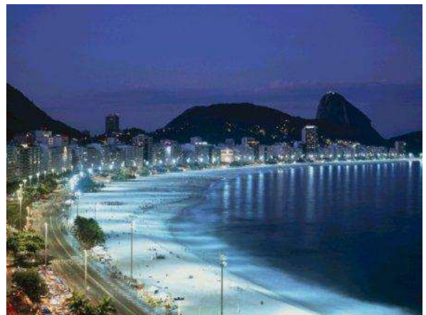
Playa en Busan