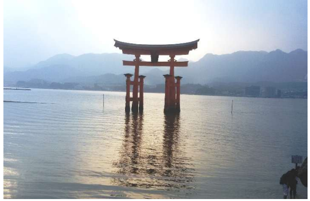
Isla de Miyajima