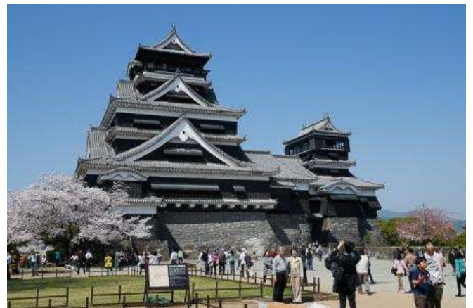
Castillo de Kunamoto