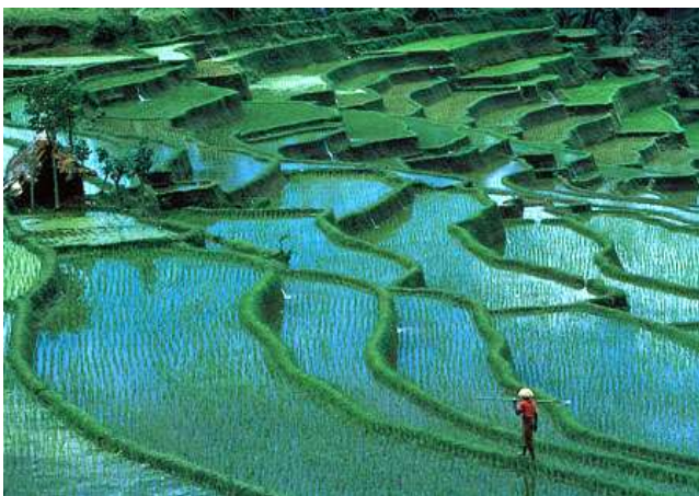
Arrozales en Bali