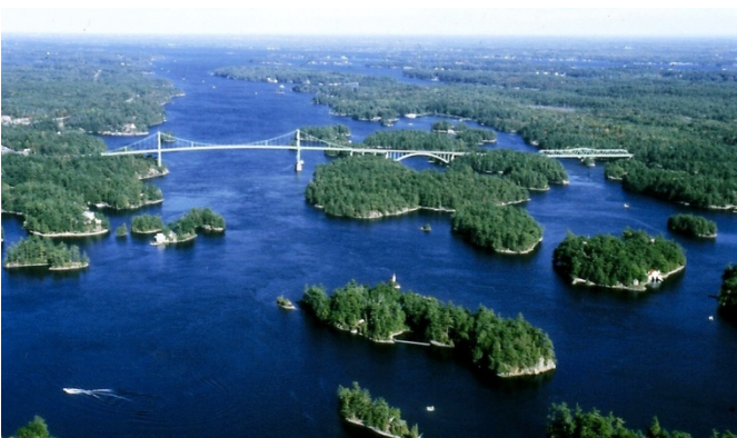
Crucero de las 1.000 islas