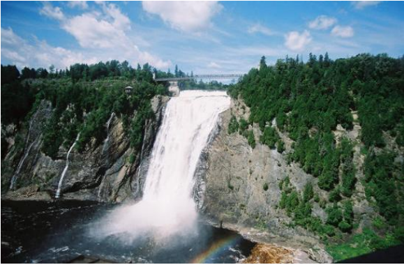
Cascadas de Montmorency