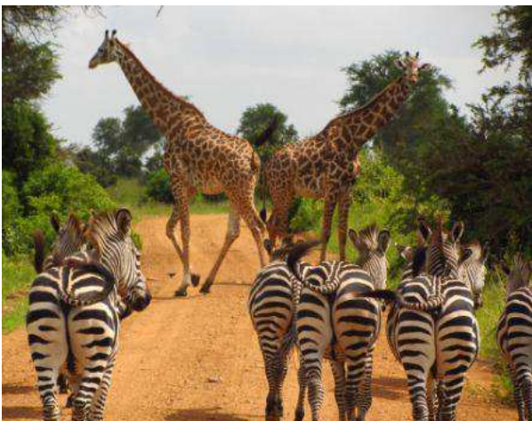
Mikumi national park