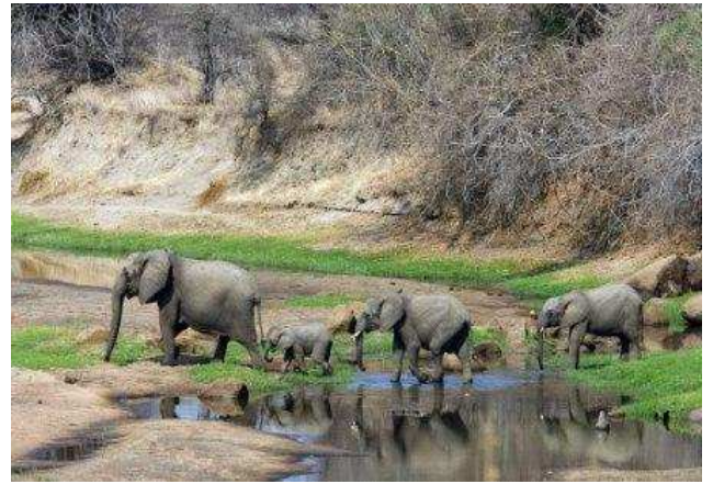
Ruaha National Park