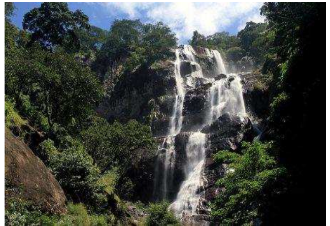
Udzungwa mountains national park