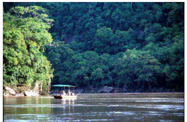
Rufiji river (Selous)