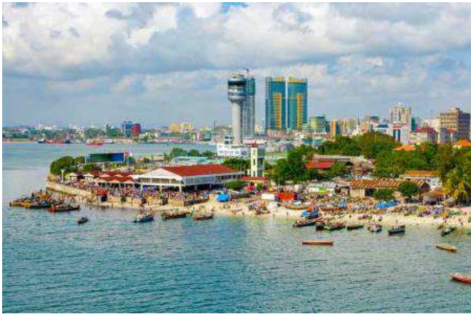
Dar Es Salaam