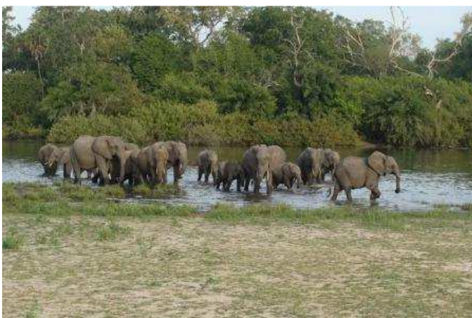
Selous game reserve