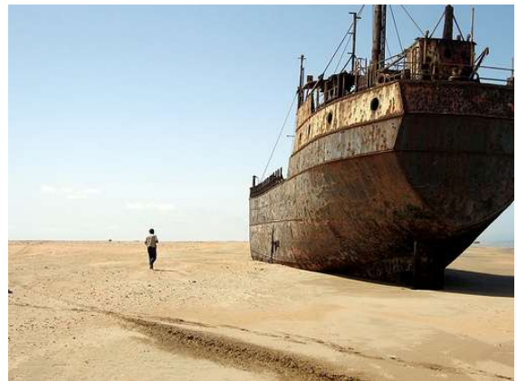
Costa de los esqueletos