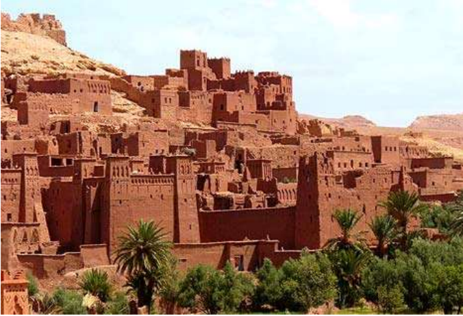
Ait Ben haddou