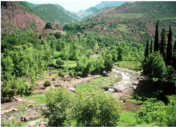
Valle de Ourika