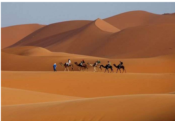
Dunas de Merzouga