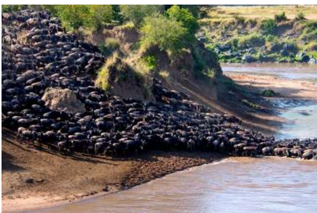
Río Mara (Masai Mara)