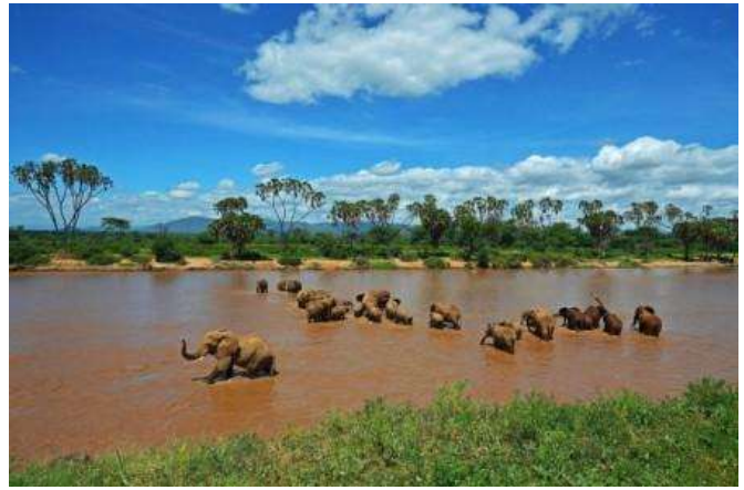
Samburu national reserve