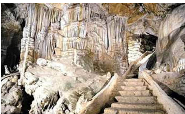
Cuevas de Campanet