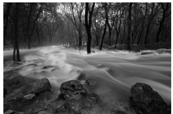
Ses Fonts Ufanes