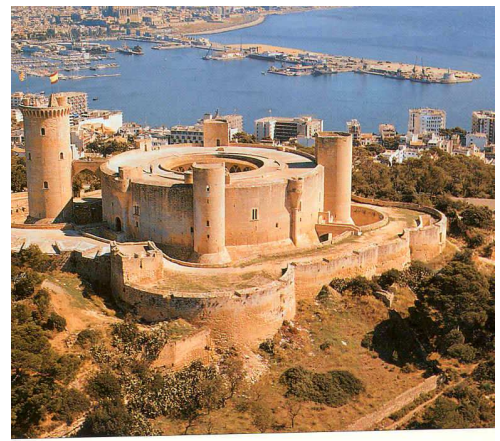
Castillo de Bellver y Palma