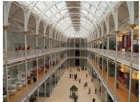
National Scottish Museum