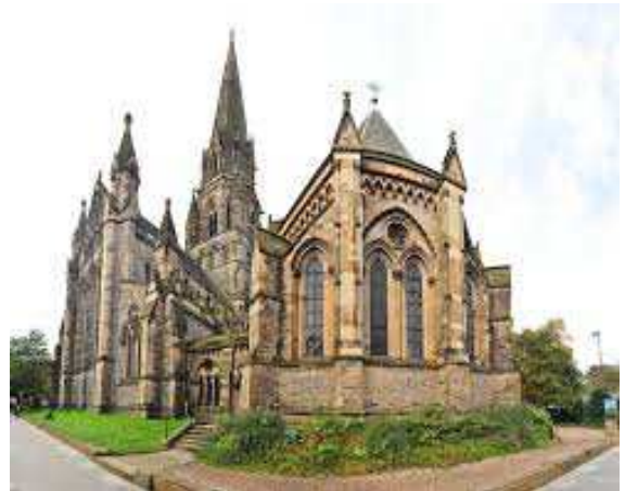
St. Mary's Cathedral