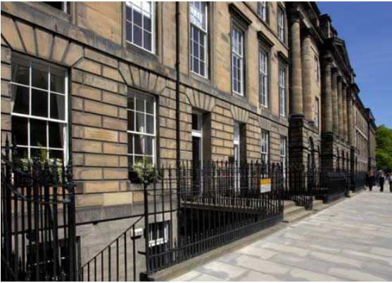
Edinburgh Language Academy