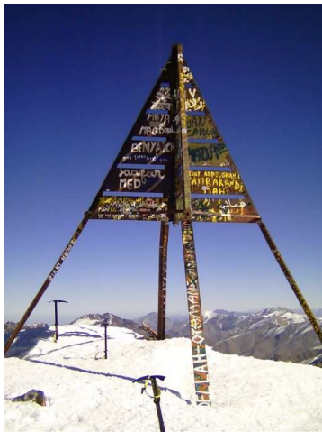
Cim del Toubkal