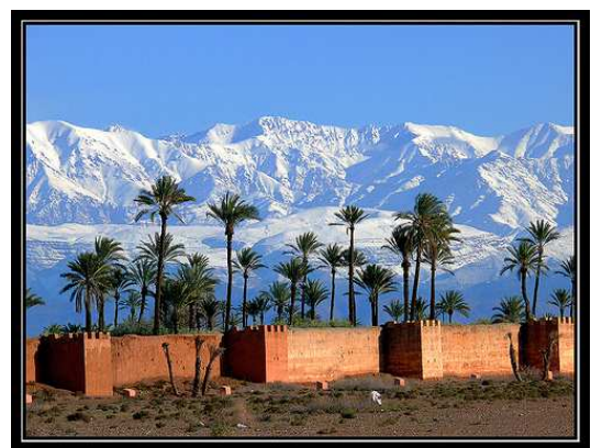
Marrakech amb l'Atlas al fons