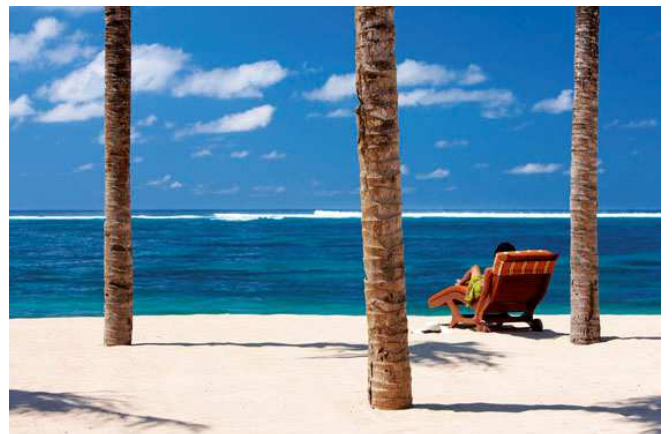
Platges a Bali