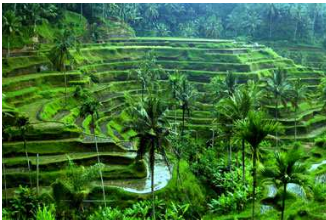
Arrossars a Bali