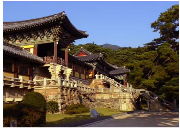
Palau a Gyeongju