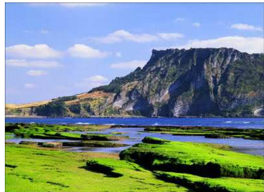
Illa de Jeju