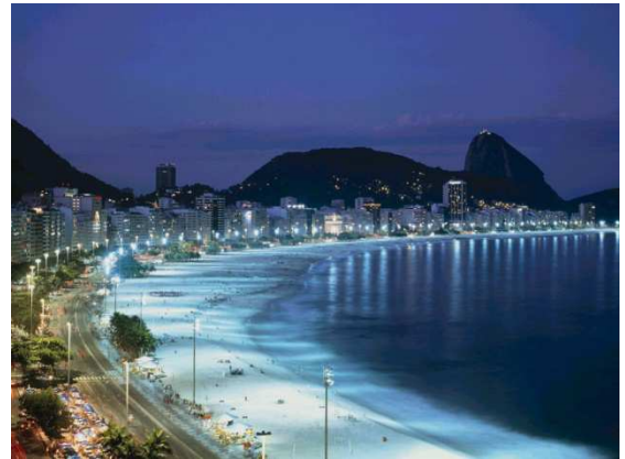
Platja a Busan