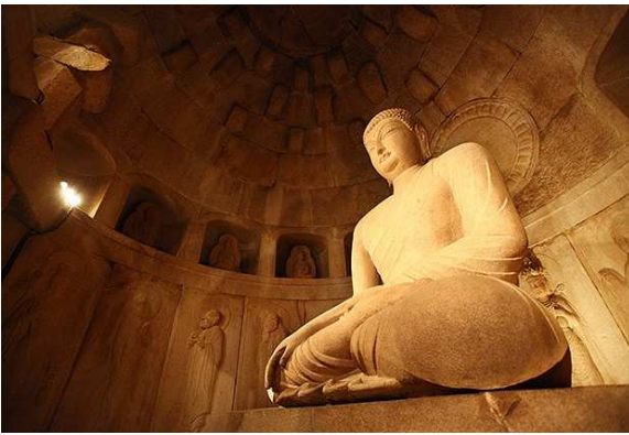
Buda a Gyeongju