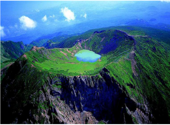
Illa de jeju