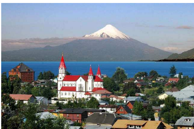
Puerto Varas, Ilac Llanquihue i volcà Osorno