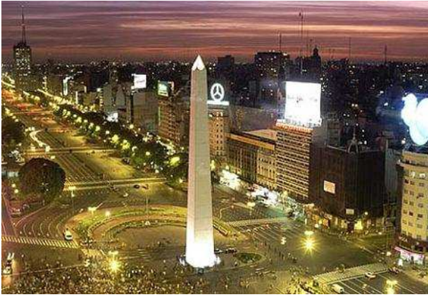
Buenos Aires: obelisc