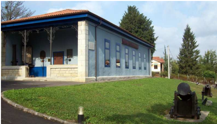
Fàbrica de maquetes de vaixells a San Cristóbal