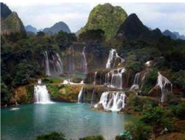
Cascades a Jarabacoa