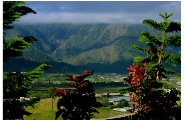
Vall de Constanza