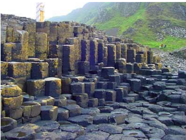
Giant's Causeway (Petjada del gegant)