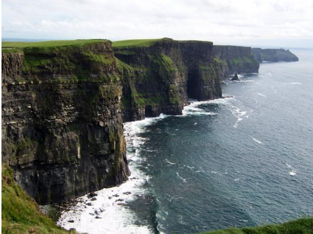
Penyassegats de Moher