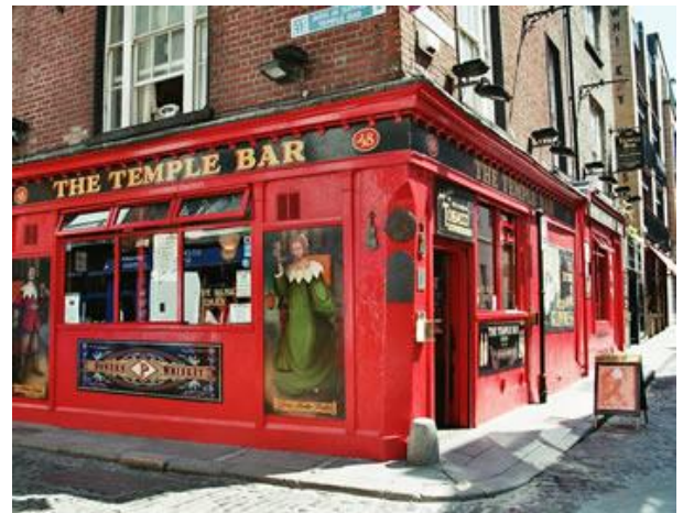
Pub al barri Temple bar de Dublin