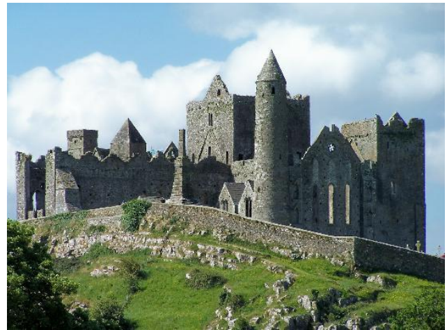
Rock of Cashel