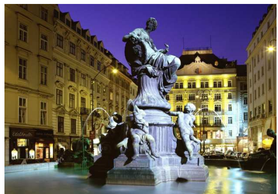
Centre de Viena