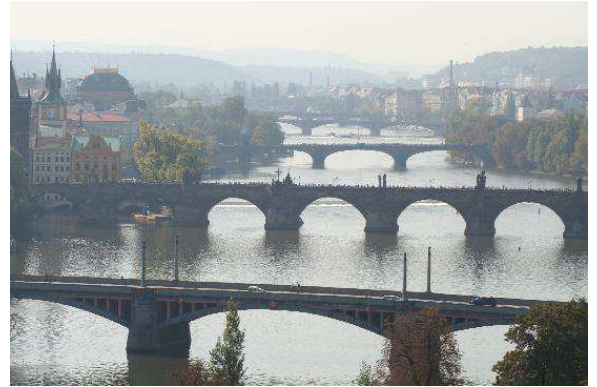
Ponts al centre de Praga