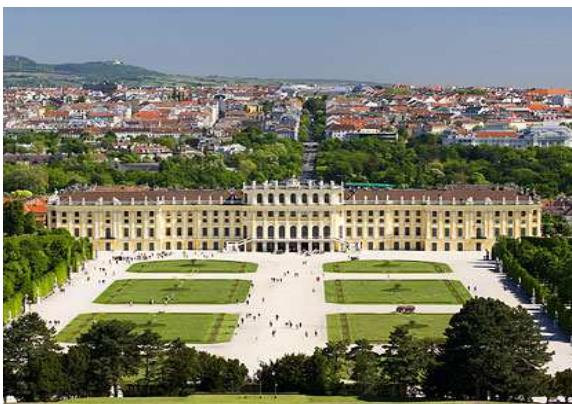
Palau de Schonbrunn a Viena