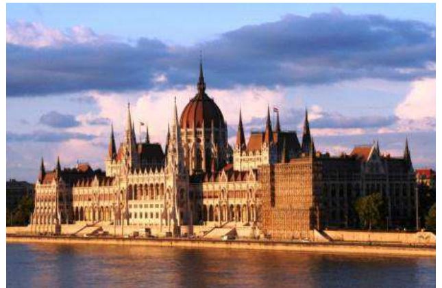
Parlament de Budapest