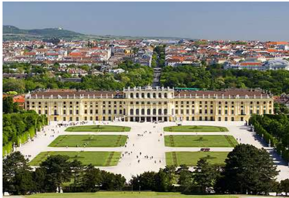
Palau de Schonbrunn (Viena)