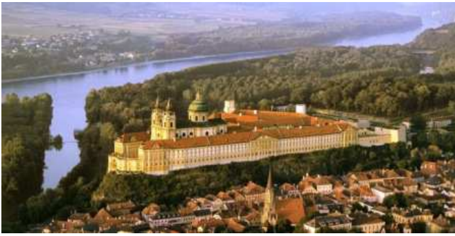
Abadia de Melk