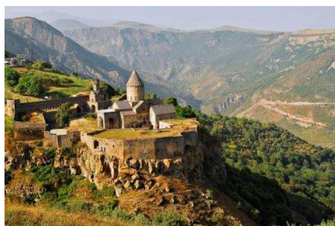
Monastir de Tatev