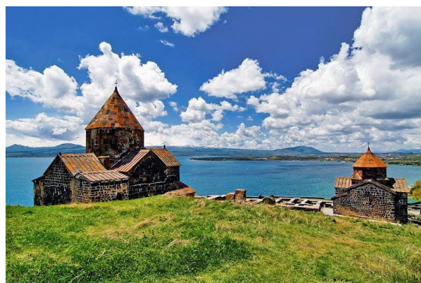
Sevanavank i llac Sevan