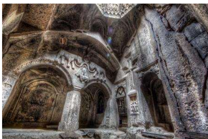
Interior del monastir de Geghard