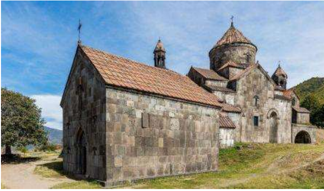
Monestir de Haghpats