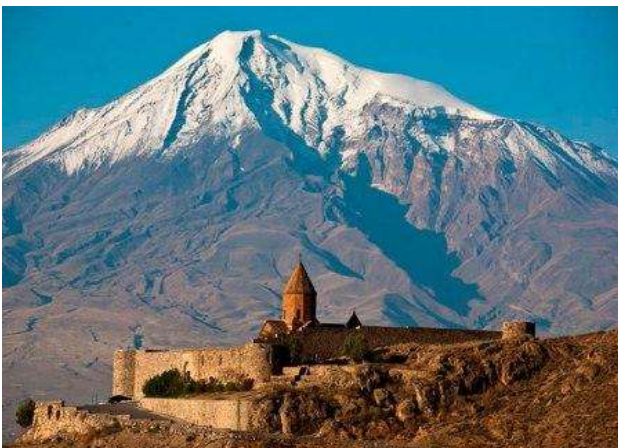
Monastir de Khor Virap i mont Ararat (Turquia)