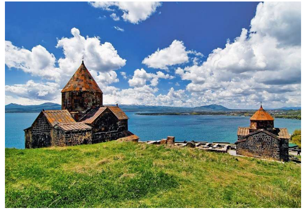
Sevanavank i llac Sevan