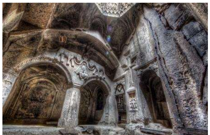
Interior del monastir de Geghard