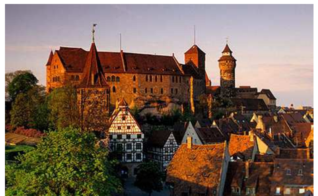
Castell de Nuremberg