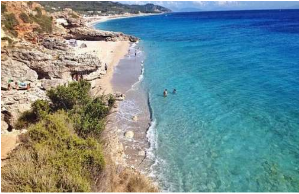
Platges de Dhermi