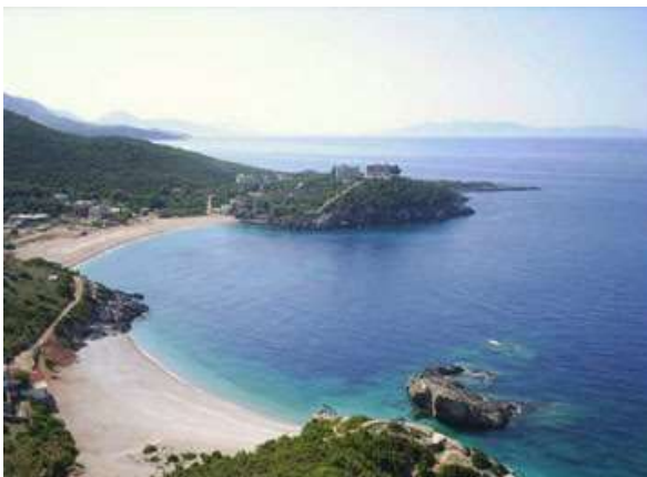
Platja de Shëngjin