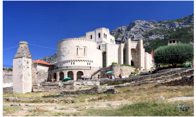
Krujë, fortaleza i museu