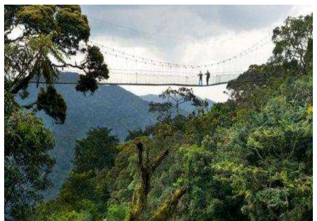
Nyungwe Forest National park