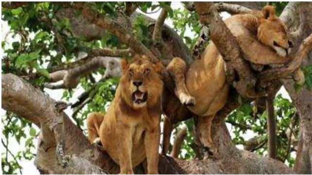
Lleons grimpadors a Queen Elisabeth National park