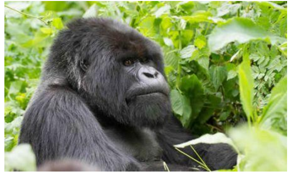
Mgahinga National park