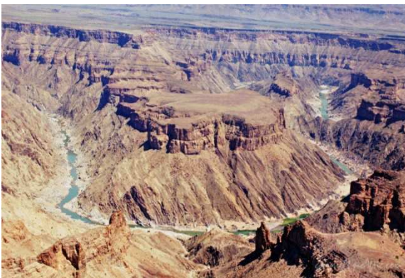
Fish River Canyon, Namíbia