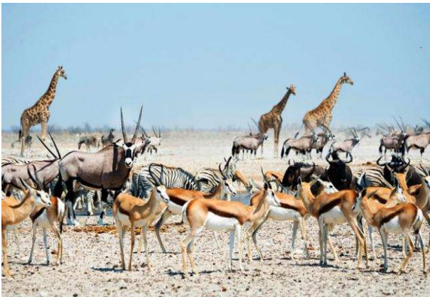
Etosha National Park, Namíbia