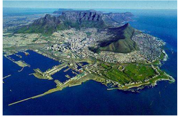
Ciutat del cap, Sud-àfrica