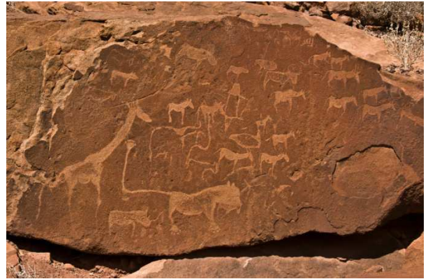
Gravats a Twyfelfontein, Damaraland