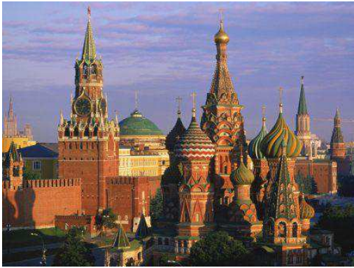
Moscú- Kremlin (Rusia)