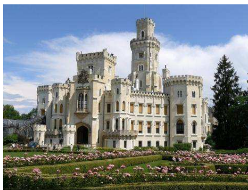
Hluboká nad Vltavou