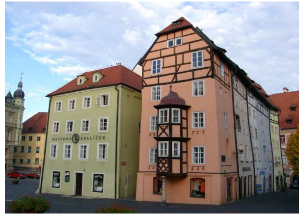
Casas medievales de Cheb