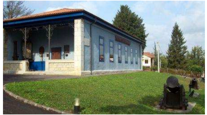
Fábrica de maquetas de barcos en San Cristóbal