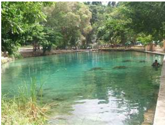
Piscina natural de aguas termales