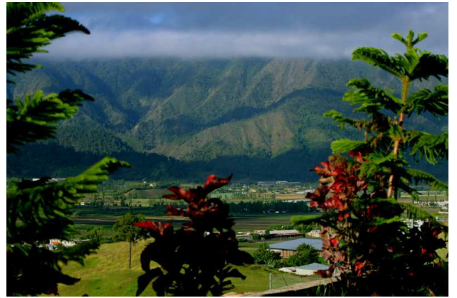
Valle de Constanza