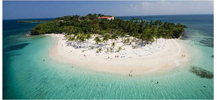
Cayo Levantado, Samaná