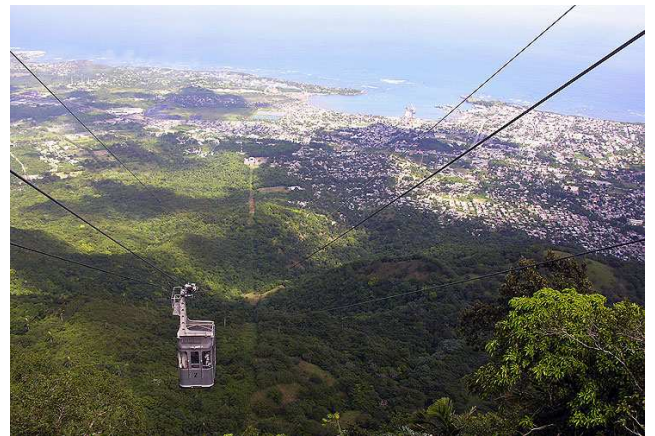
Teleférico a Puerto Plata