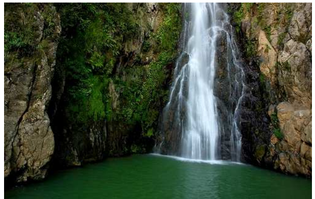
Cascada de Aguas Blancas