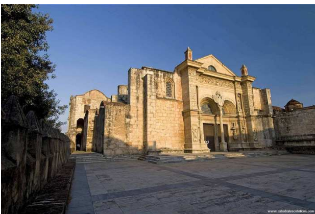
Catedral de Santo Domingo