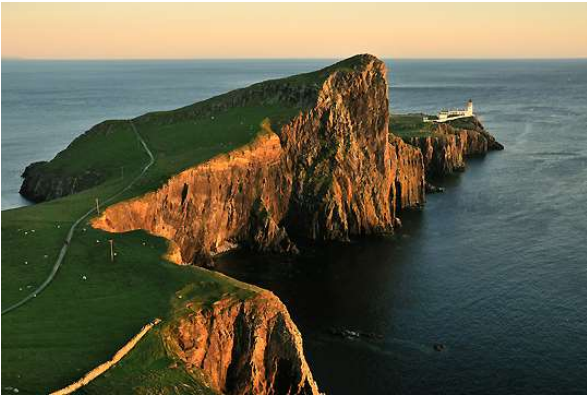
Isla de Skye