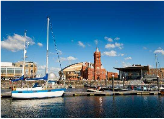
Bahía de Cardiff