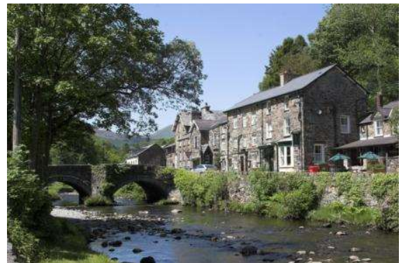
Parque Nacional de Brecon Beacon