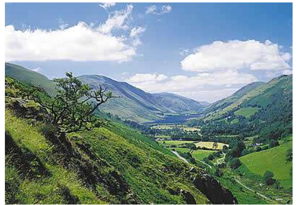
Parque Nacional de Snowdonia