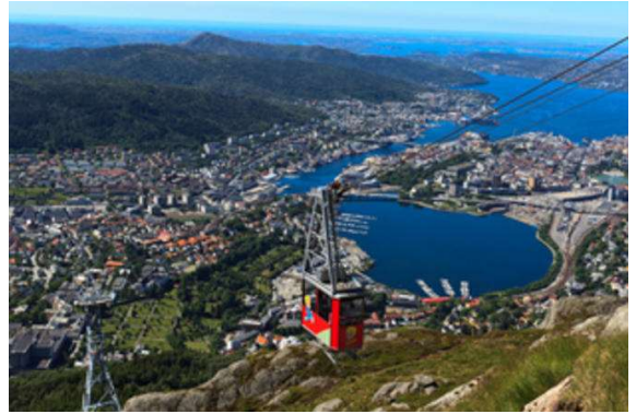
Bergen, desde el aire