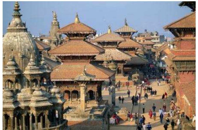
Duhar square, Patan