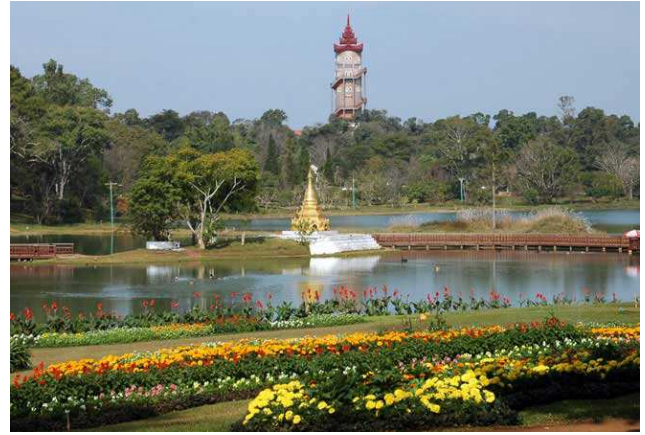
Jardin botánico de Pyin Oo Lwin