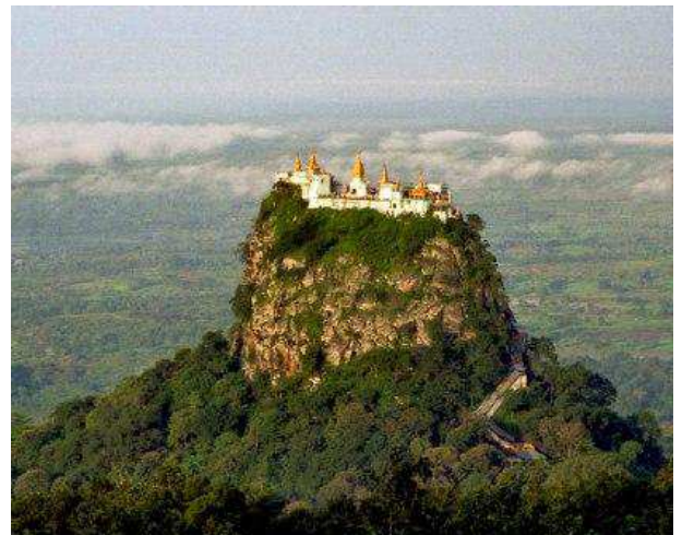
Taung Kalat monastery, Monte Popa