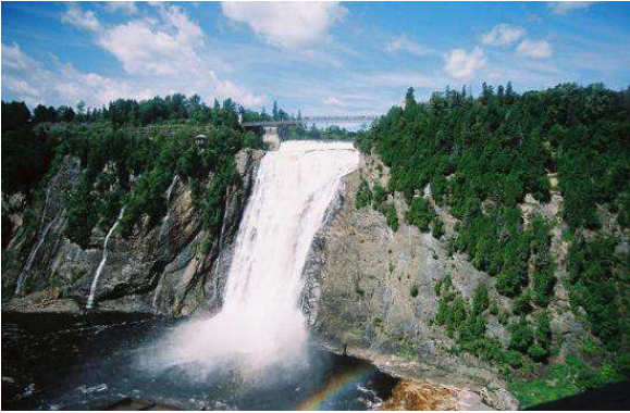
Cascadas de Montmorency