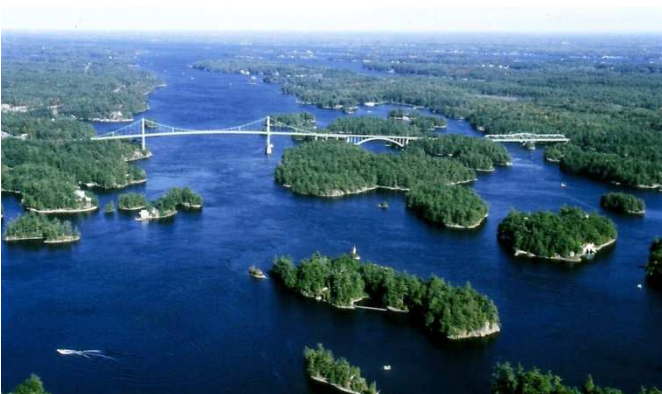
Crucero de las 1.000 islas