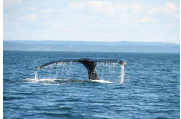
Ballenas en Tadoussac