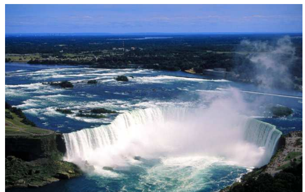
Cataratas del Niagara